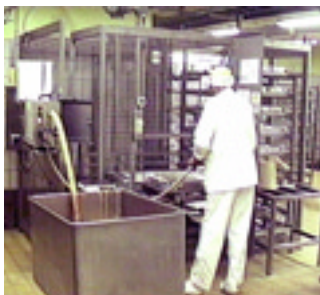
Fillflex suger pastejsmeten direkt ur skänkvagnen.