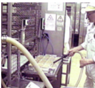
Maskinen startar automatiskt efter inställd paustid mellan formarna.

Maskinen har använts dagligen i flera år och gjort fyllningsarbetet mycket effektivt.