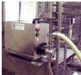
Fillflex Compact har små ytermått och är mycket lättplacerad.