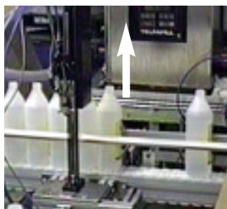
Fyllningen avslutad och lansen har lämnat den fyllda flaskan.