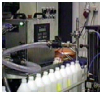
Fillflex är tack vare små yttermått mycket lättplacerad.